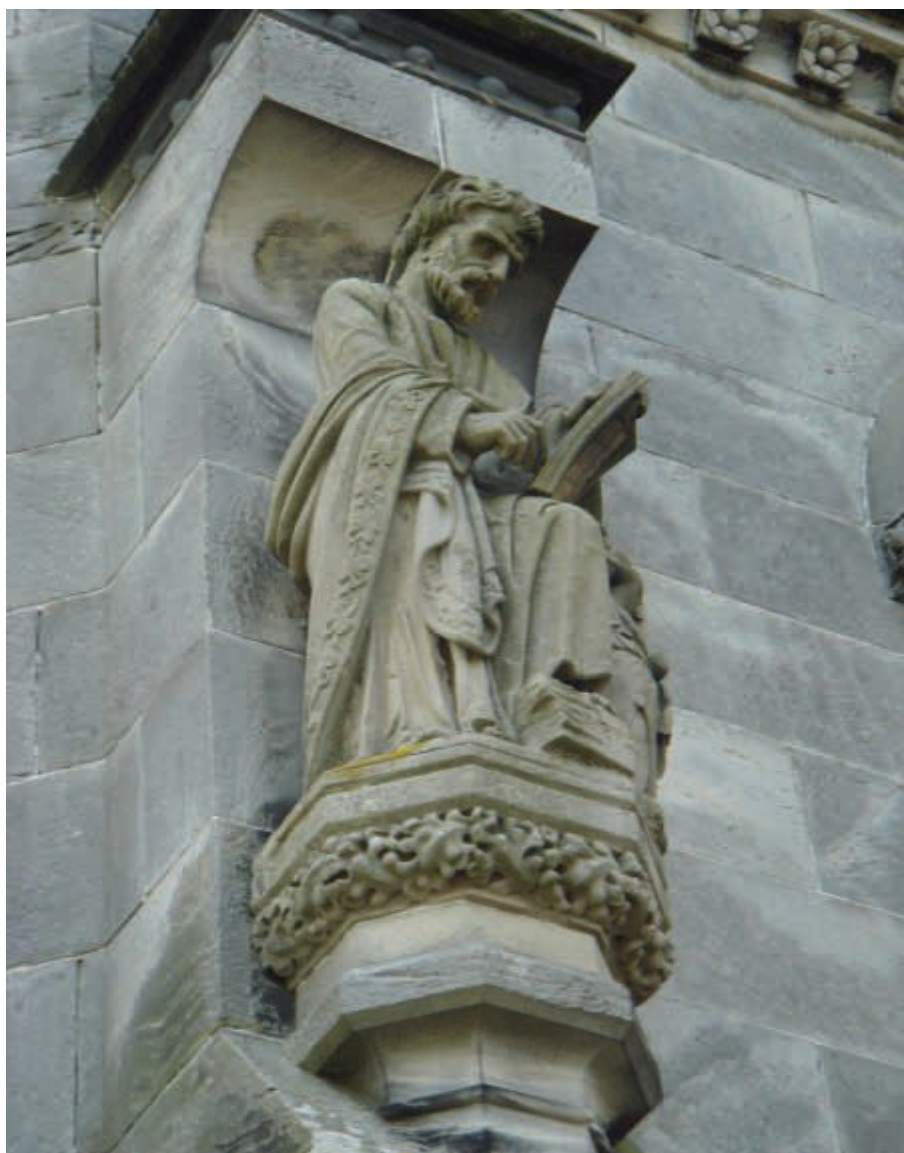
Rosslyn Chapel (Escocia)

Adhiérase al CIEM Para mayor información, dirijase a: