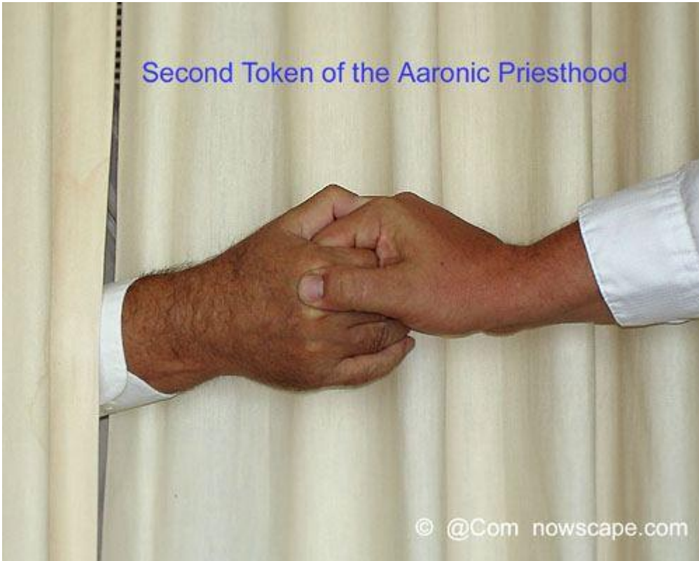
Second Token of the Aaronic Priesthood