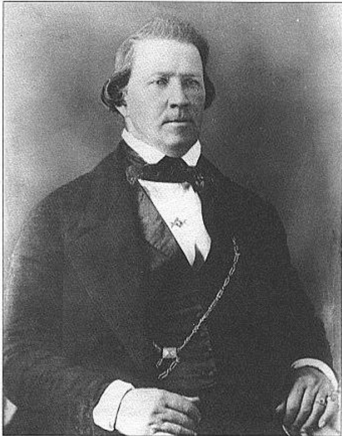
Brigham Young revised and institutionalized Joseph Smith's temple ceremonies beginning in late 1845 in Nauvoo. Note the Masonic square and compass pin on his shirt.