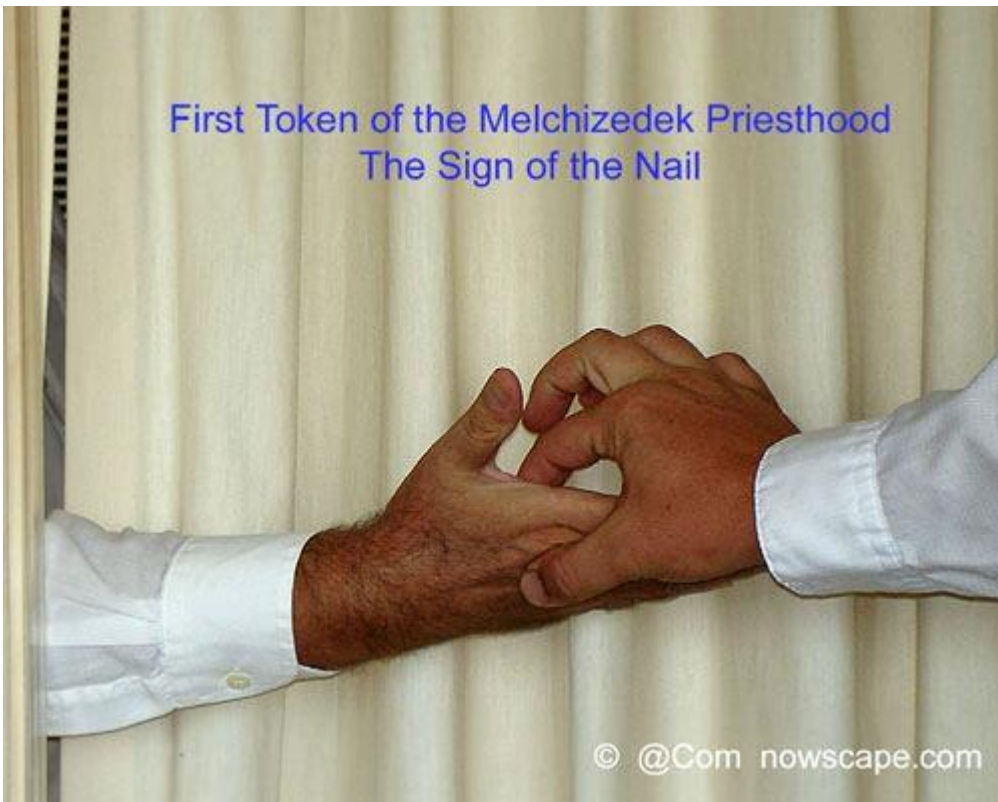
First Token of the Melchizedek Priesthood The Sign of the Nail