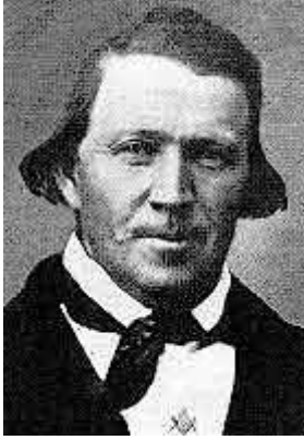
Brigham Young avec compas et équerre

Cette appartenance de tous les fondateurs de l'église mormone à la Franc-Maçonnerie a troublé ensuite beaucoup de mormons, peu favorables à l'ordre.