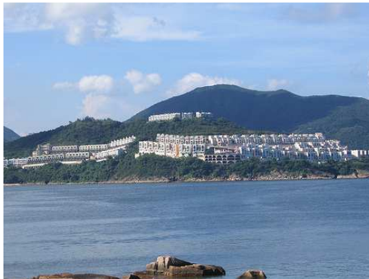
Prisão Stanley, Hong kong.

como a Perseverance Lodge No. 1165 EC funcionaram em campos de prisioneiros (Prisão Stanley/ Stanley prison). Ainda hoje existe o Livro da Perseverance Lodge No. 1165 com atas do período.