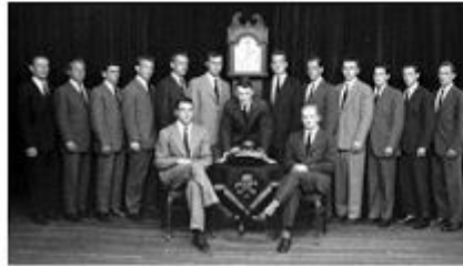
Logia Paramasónica Skull & Bones