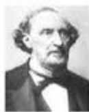
Bartolomé Mitre (1821 1906)