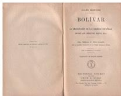
Bolívar y la Emancipación de las Colonias Españolas, París, 1912.